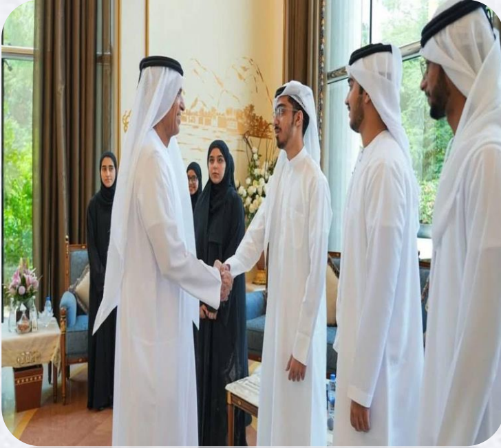
تكريم يُبهج القلوب

صاحب السمو الشيخ / سعود القاسمي حاكم رأس الخيمة حفظه الله يستقبل أوائل الثانوية العامّة 2025